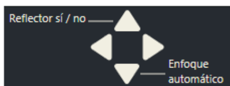
Fig. 4: Vista ejemplar de la asignación de teclas de la leviacam en el software