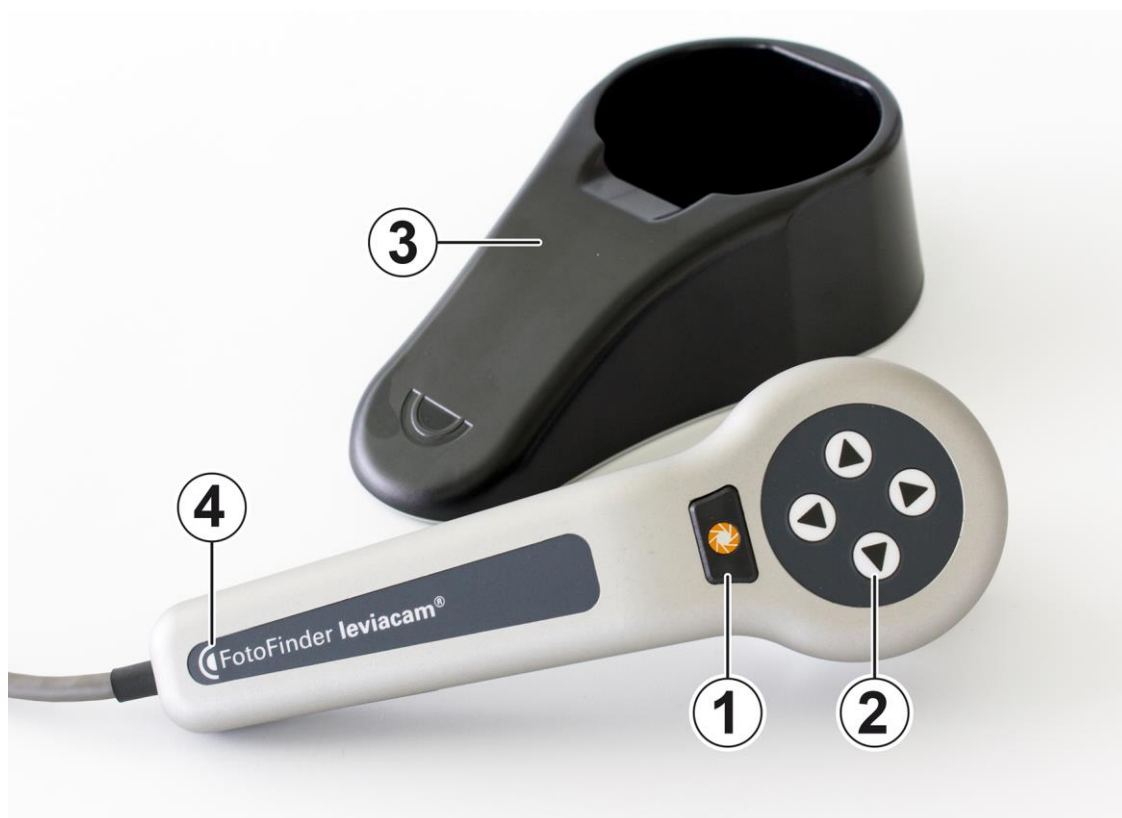
Fig. 1: FotoFinder leviacam®