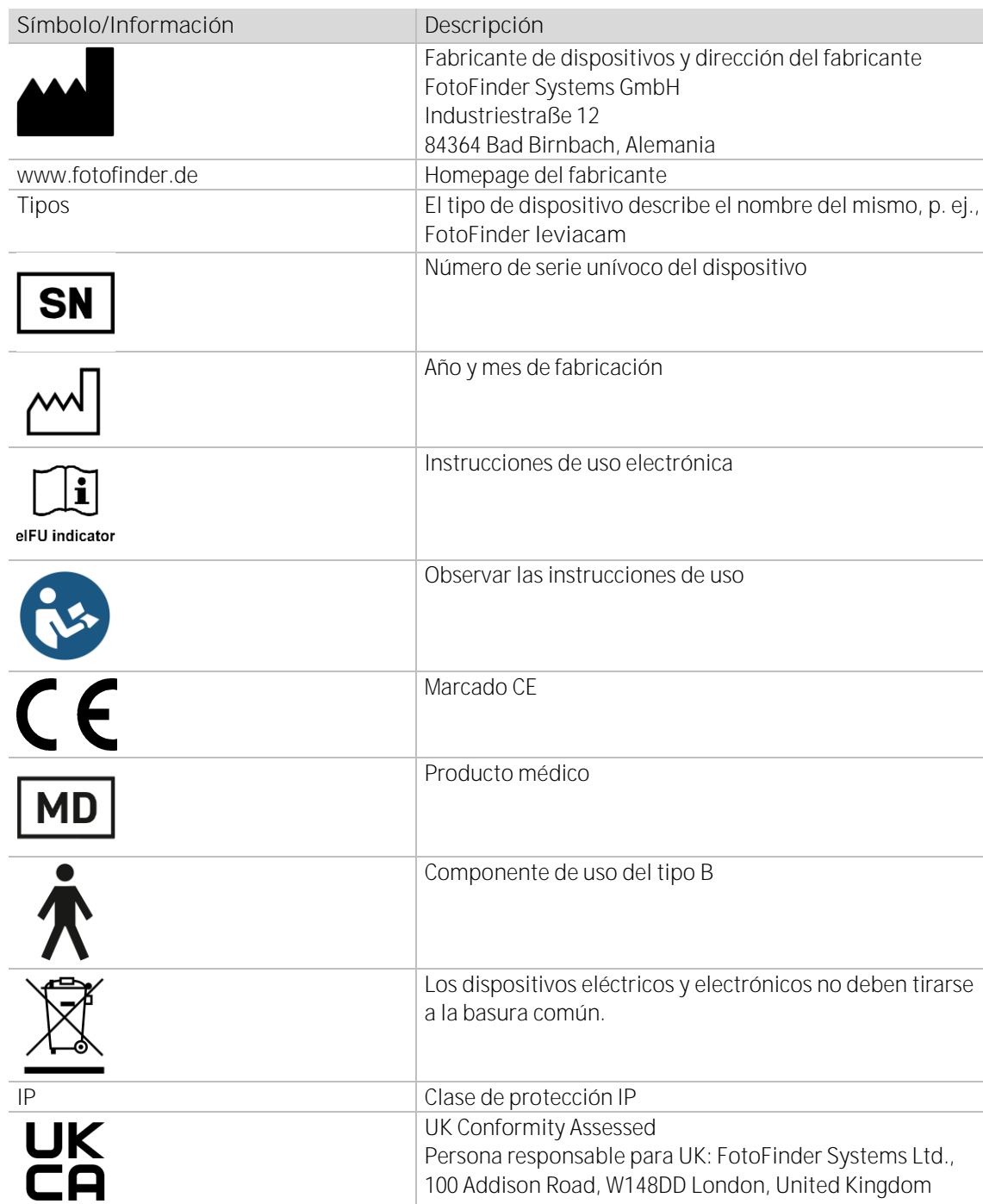
Tab. 1: Explicaciones de las placas de características leviacam y leviabase

Seguidamente encontrará los detalles de la placa de características colocada en el dispositivo, así como las placas de características colocados en los elementos del sistema.