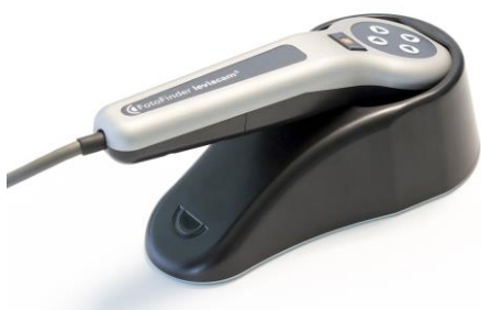
Fig. 6 leviacam en leviabase

La leviacam se entrega con el soporte de la cámara leviabase para su almacenamiento seguro.