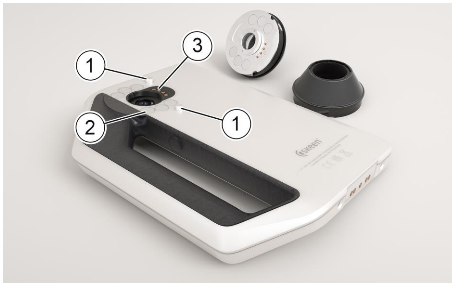
Abb. 2: FotoFinder skeen mit abgenommenem Vorsatzobjektiv