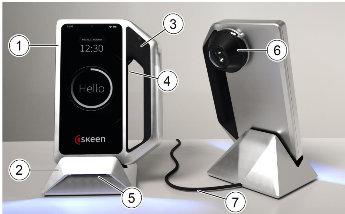
Abb. 1: FotoFinder skeen (Vorder- und Seitenansicht) in Ladestation